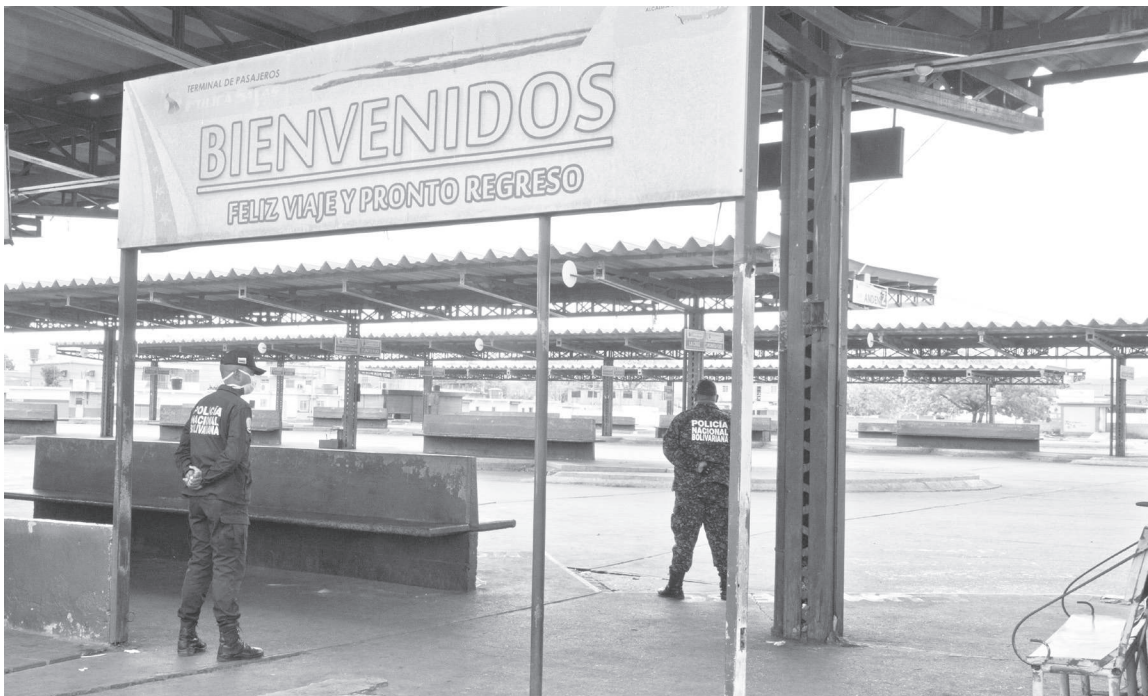
POR PREVENCIÓN: El desalojo de las unidades del transporte extraurbano del terminal terrestre de Coro es preventivo y temporal, para protección de los usuarios.