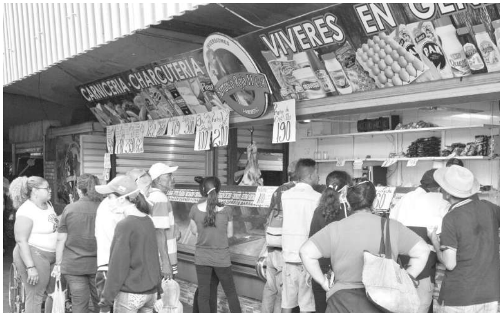
PRECAVIDOS: Los consumidores corianos realizan sus compras para varios días.

cados municipales en Miranda, abogado Carlos Ugarte, puntualizó la fiscalización permanente en los comercios para verificar el acatamiento de los lineamientos del Presidente de la República, así como del gobierno regional y municipal.