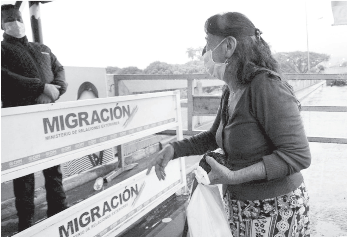
CAUSA COMÚN: Ambos países se han acercado para trazar estrategias que permitan frenar la propagación del COVID-19.

“A través de la OPS se reportará información epidemiológica y se verificará la capacidad instalada en frontera para dar respuesta y afrontar este desafío de salud pública mundial”, dijo el vecino país.