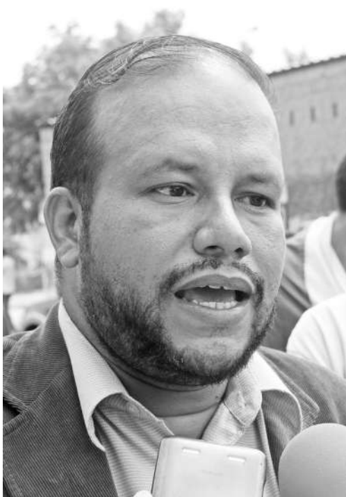
ABOGADO: Guerrero dijo que hay que cumplir los decretos emanados por los organismos pertinentes.

“Los empleados deben tomar medidas. Autoridades nacionales y regionales han prohibido que la mayoría de los negocios abra, para evitar las concentraciones de masa; hay otros casos que sí deben abrir como farmacias y expendios de alimentos”, explicó. En el caso de los patronos, estos deben apegarse a lo que establece el decreto, porque es la salud la que está comprometida. Los trabajadores que se sientan afectados por esta medida con despidos arbitrarios deben ir a la Inspección de Trabajo, colocar la denuncia para ser reenganchados; hay sanciones en la Ley Orgánica del Trabajo, lo que implicaría hasta privativa de libertad para aquellos patronos que no permiten el reenganche de sus empleados.