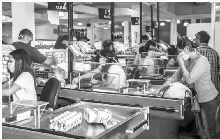
CUARENTENA: En alto porcentaje, los peninsulares acataron la medida sanitaria del gobierno nacional.

La zona de Puerta Maravén, por la avenida Ollarvides presentó tráfico vehicular y movimiento de compradores en los supermer-