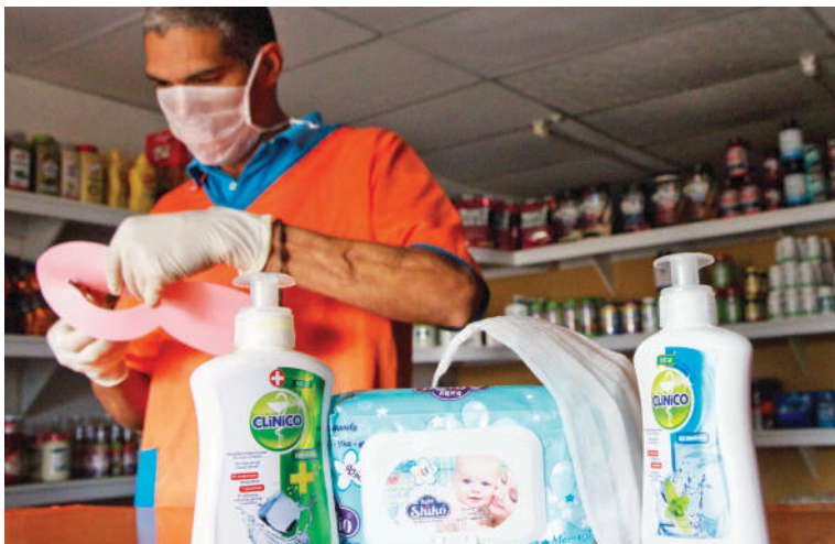
EN ESPERA: El ramo farmacéutico oferta toallitas húmedas y jabón antibacterial, a la espera de los proveedores para surtir de tapabocas, guantes y productos a base de alcohol.

Entretanto, en Farmaclub no cuentan con los referidos productos ni tampoco esperan pedidos. Por su parte, los consumidores que esperaban ser atendidos expresaron que es necesario un control de precios. "El gobierno debe fiscalizar porque hay farmacias donde están especulando con los precios", manifestó un cliente que prefirió no identificarse.