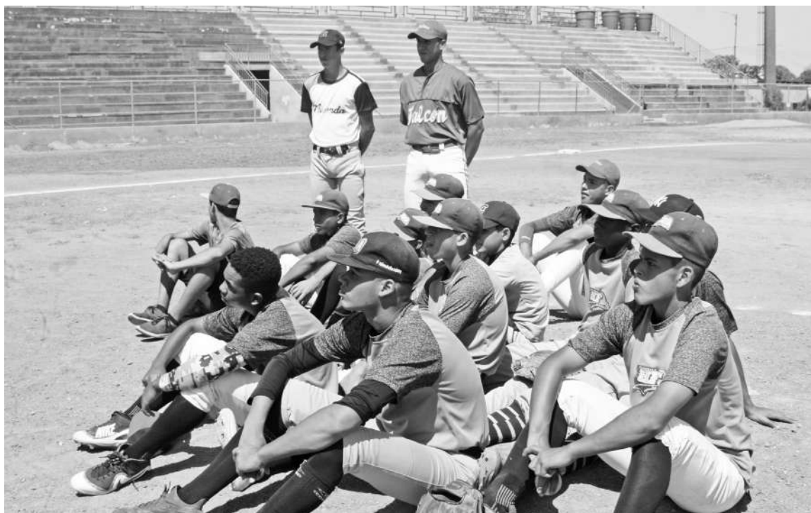
TURNO EN ESPERA: Un nutrido grupo de jóvenes mostró sus talentos.