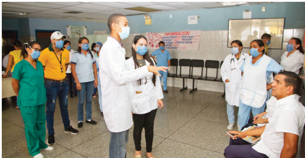
DISPUESTOS: Diferentes ambulatorios han conformado los triajes para brindar atención a los pacientes con problemas respiratorios sin afectar sus servicios regulares.

Tal como lo anunció este lunes el secretario de Salud en Falcón, doctor Jesús Osteicochea, el monitoreo a la red de salud se está efectuando las 24 horas al día en los 25 municipios. "En el sistema de salud falconiano seguimos trabajando, sumando esfuerzos y cumpliendo las medidas orientadas por el presidente Nicolás Maduro y del gobernador Víctor Clark, para garantizar la tranquilidad y estabilidad de nuestro pueblo", indicó. Osteicochea reiteró que se han organizado según los ejes de la entidad y así poder cumplir el control las 24 horas. "Ya se han distribuido los insumos de bioseguridad —tapabocas y guantes—, mantenemos la articulación